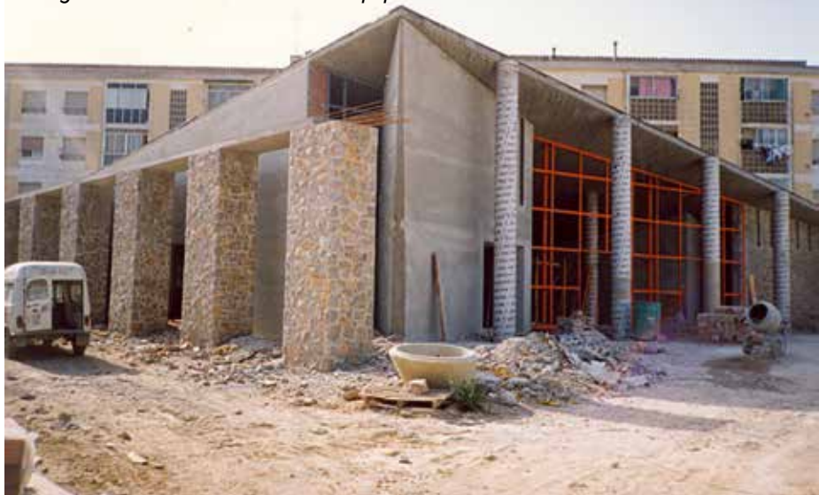
Imatges de la construcció del nou equipament del barri Vilarnau