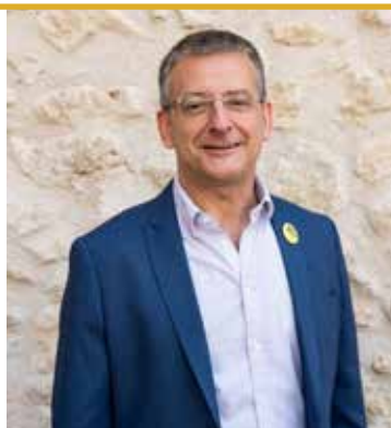
Ton Amat Alcalde de Sant Sadurní